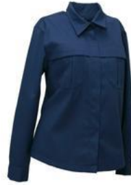
Partiopaita naisten leikkauksella